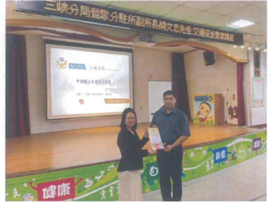
湖山派出所胡副所長利校宣導交通安全，並提醒學童避免與車爭道造成危險