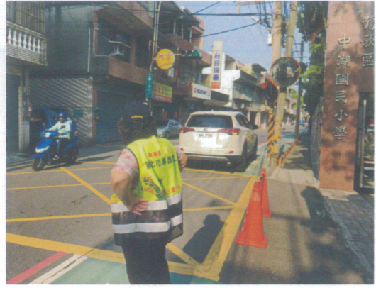
導護值勤實況，會有車輛停放標線型人行道造成學童通行危險