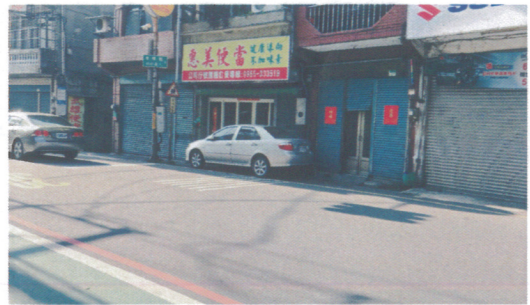
對面鄰居將車停放門口易縮減學童通行路幅，需走在馬路與車爭道