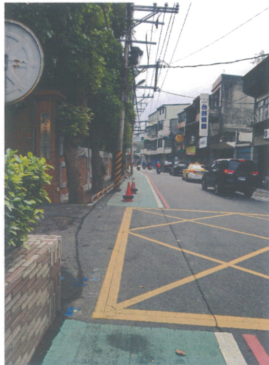
現有實體人行道於多年前校地後縮建置，因人行道上老樹增長導致可通行步道狹窄不易通行。