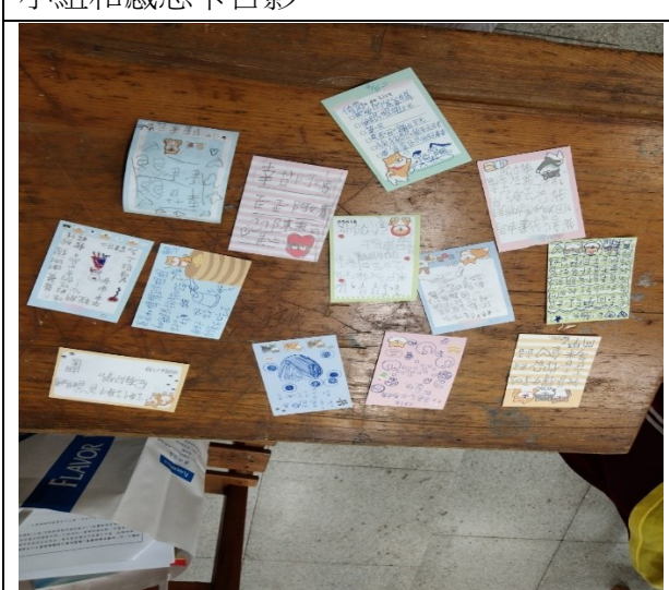
寫給家人的米食感恩卡