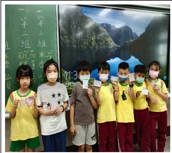
小組和感恩卡合影