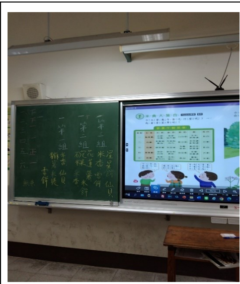
每一組帶來的米製品