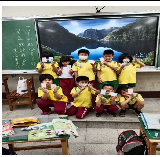
小組和感恩卡合影