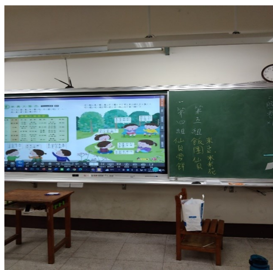
每一組帶來的米製品