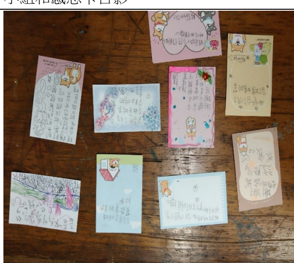
寫給家人的米食感恩卡