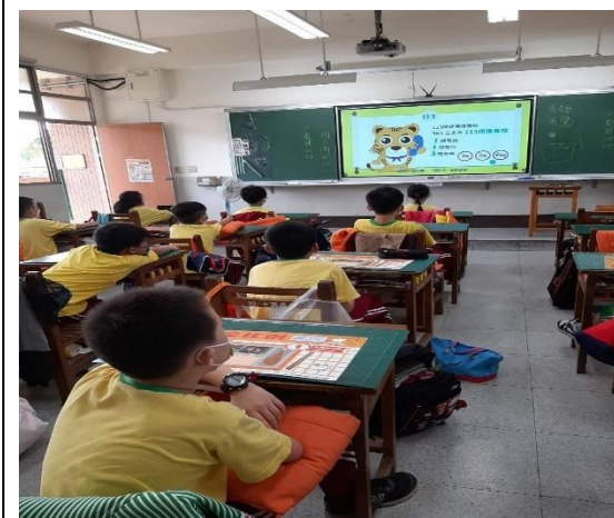
打 113 專線