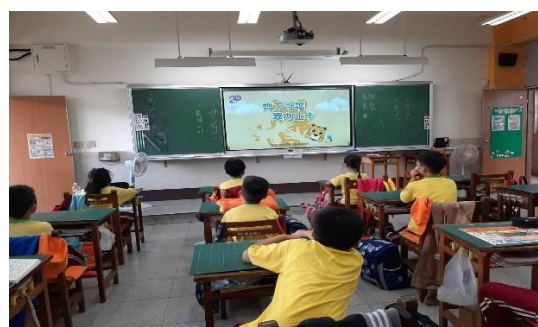
齊力守護暴力止步