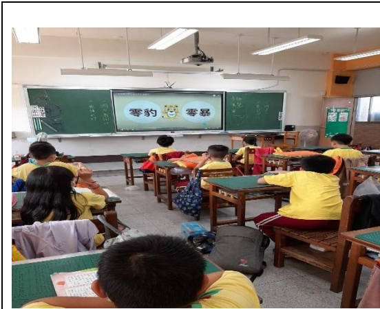
零約零暴影片欣賞